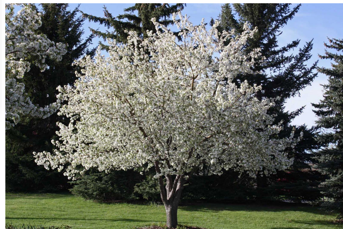
Spring Snow White Crabapple