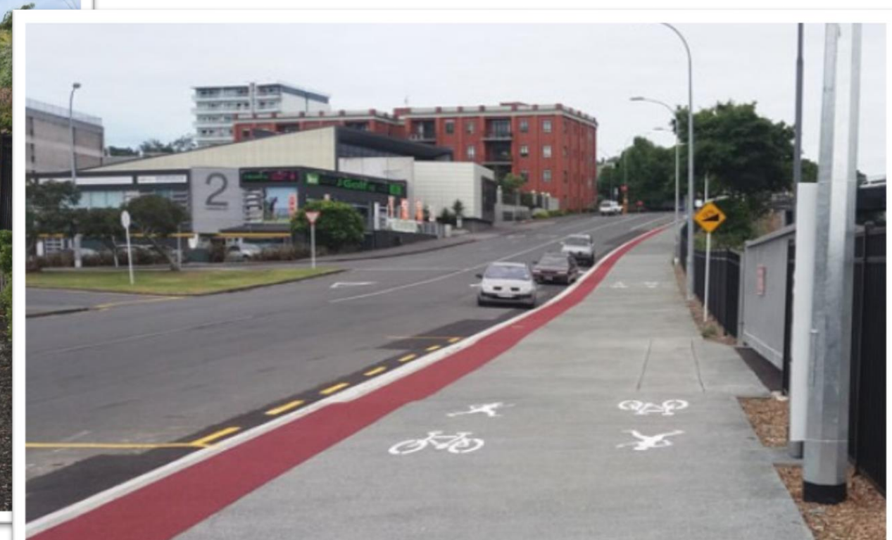
Proposed Sidepath Examples/ Ejemplar de carril para bicicleta y peatones propuesto