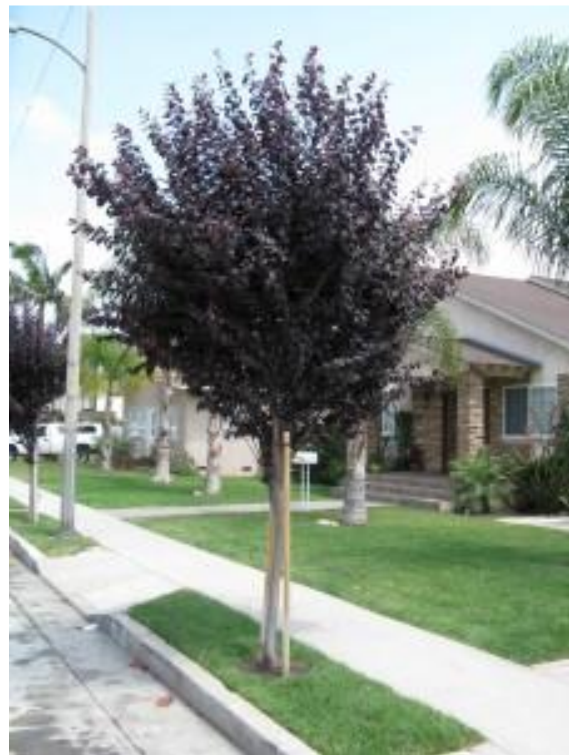
Proposed Street Tree Example/Ejemplar de árbol propuesto