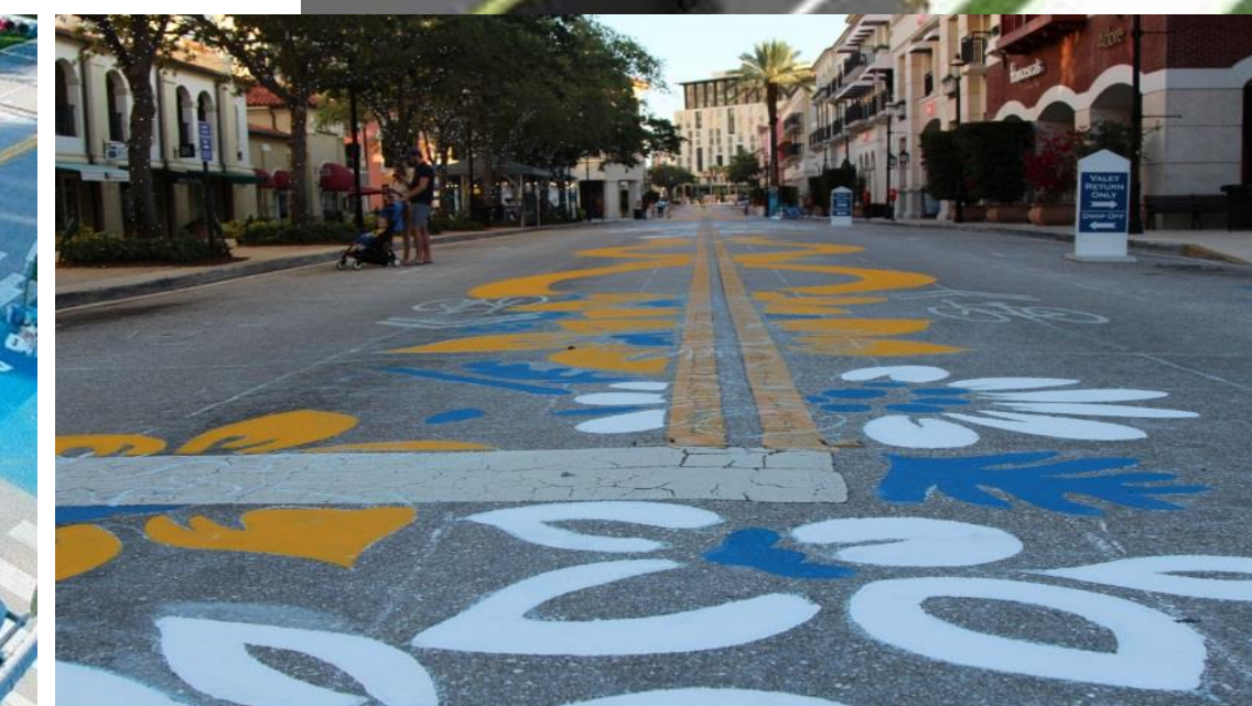
Examples of Temporary Street Paint for Intersection (Possibly By Local Artists) Ejemplos de arte temporal para la intersección vial (Posiblemente por artista local)